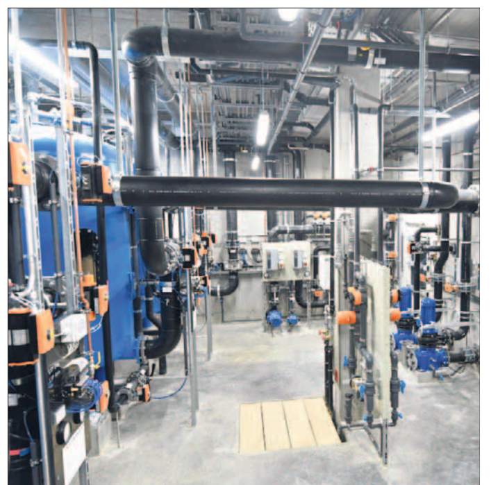
Gigantisch: Eine aufwendige neue Technik macht den Wasserspaß im Wellenfreibad Reutlingen erst möglich.