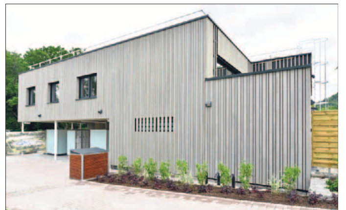
Das neue Technikgebäude mit Mitarbeiterwohnung, Umkleide- und Sanitärräumen sowie einem weiteren Zugang zum Freibadgelände, der bei großem Andrang geöffnet wird.