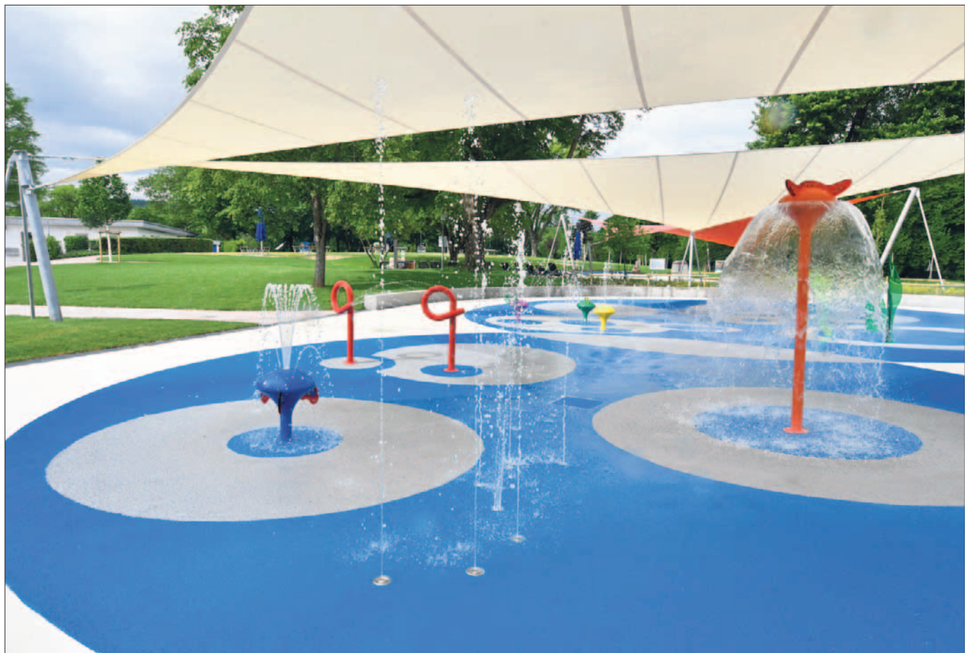
Die Wasserspiele im neuen »Splash-Park« des Wellenfreibads Reutlingen.